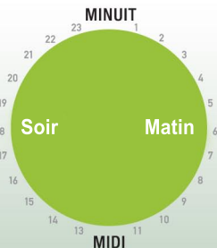
Fins de semaine et jours fériés